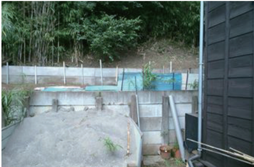
ほぼ90度です。高さは8メートルほどあります。